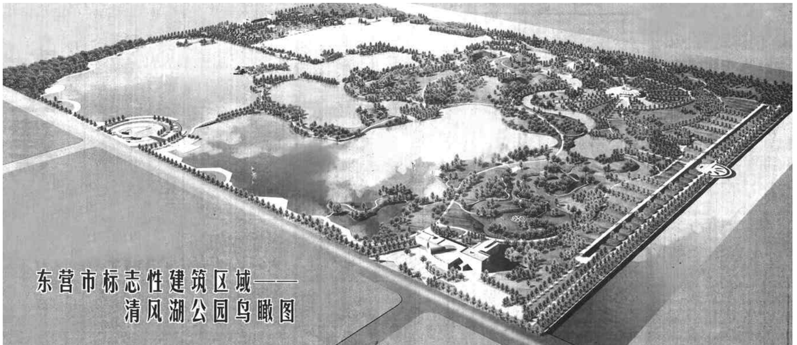
东营市标志性建筑区域——清风湖公园鸟瞰图

全省最大的城市公园——清风湖公园由东营金瀚房地产开发有限公司开发。东营金瀚房地产开发有限公司系东营金瀚科技发展有限公司等股东共同出资组建，集房地产开发、销售和物业管理于一体。公司按现代企业制度运作，经营机制灵活，项目储备充足，发展前景广阔。目前开发的主要项目有“清风湖公园”及“金瀚家园”等房地产相关业务。