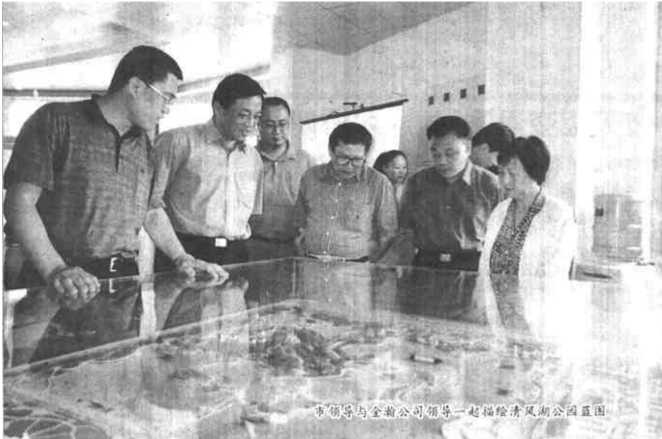
市领导与金瀚公司领导一起描绘清风湖公园蓝图